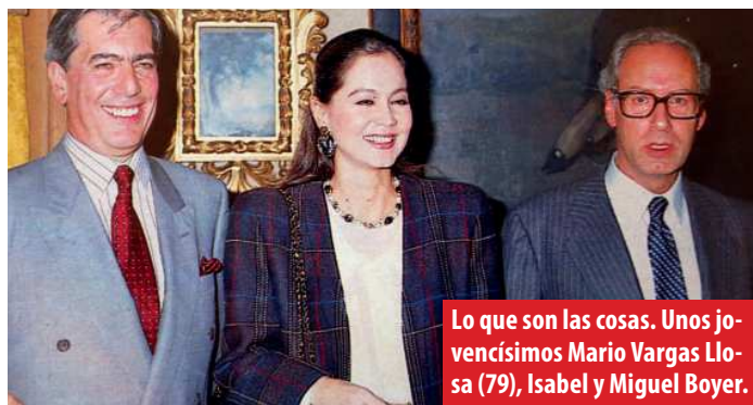
Lo que son las cosas. Unos jovencísimos Mario Vargas Llosa (79), Isabel y Miguel Boyer.