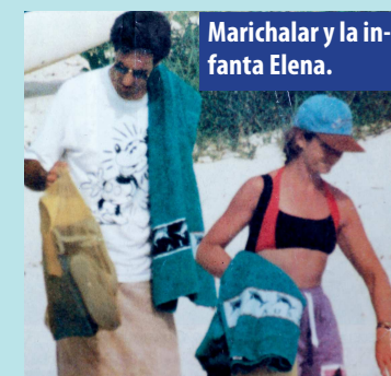
Marichalar y la infanta Elena.