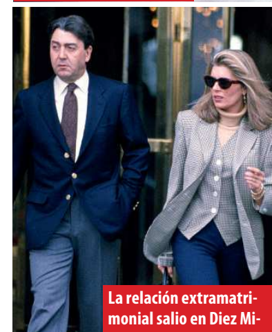
La relación extramatrimonial salió en Diez Mi-